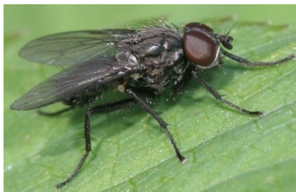
Черная пшеничная муха